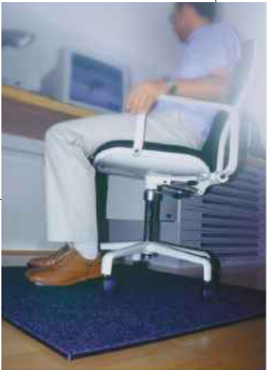
Fußwärmeplatte mit Kabel Stecker

Fußwärmeplatten sorgen für ein angenehmes und gesundes Raumklima, und sind somit eine wichtige Voraussetzung für das Wohlbefinden. Die optimale Empfindungstemperatur wird auch bei geringer Raumtemperatur erreicht. Das heißt: Die Heizkosten senken und Energie sparen! Wir haben für jeden Anwendungsfall eine individuelle Lösung!